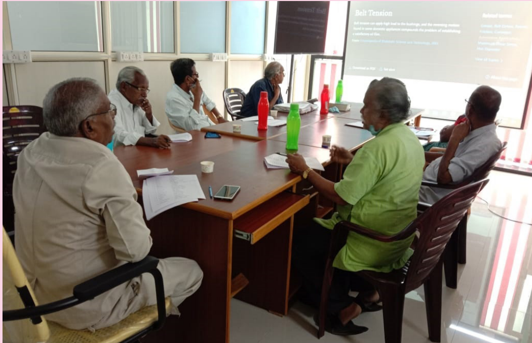
தமிழ்க் கலைக்கழகத்தின் 81 ஆவது கூட்டம் 2021 மார்ச்சு மாதம் 04ஆம் நாள் நடைபெற்றது. இக்கூட்டத்தில் அலுவல்சார், அலுவல்சாரா உறுப்பினர்கள் பங்கேற்றனர்

வள்ளல் அதியமான் கோட்டம், அதியமான் கோட்டை கிராமம் தருமபுரி மாவட்டத்தில் அமைக்கப்பட்டு 28.02.2009 அன்று திறந்து வைக்கப்பட்டது.